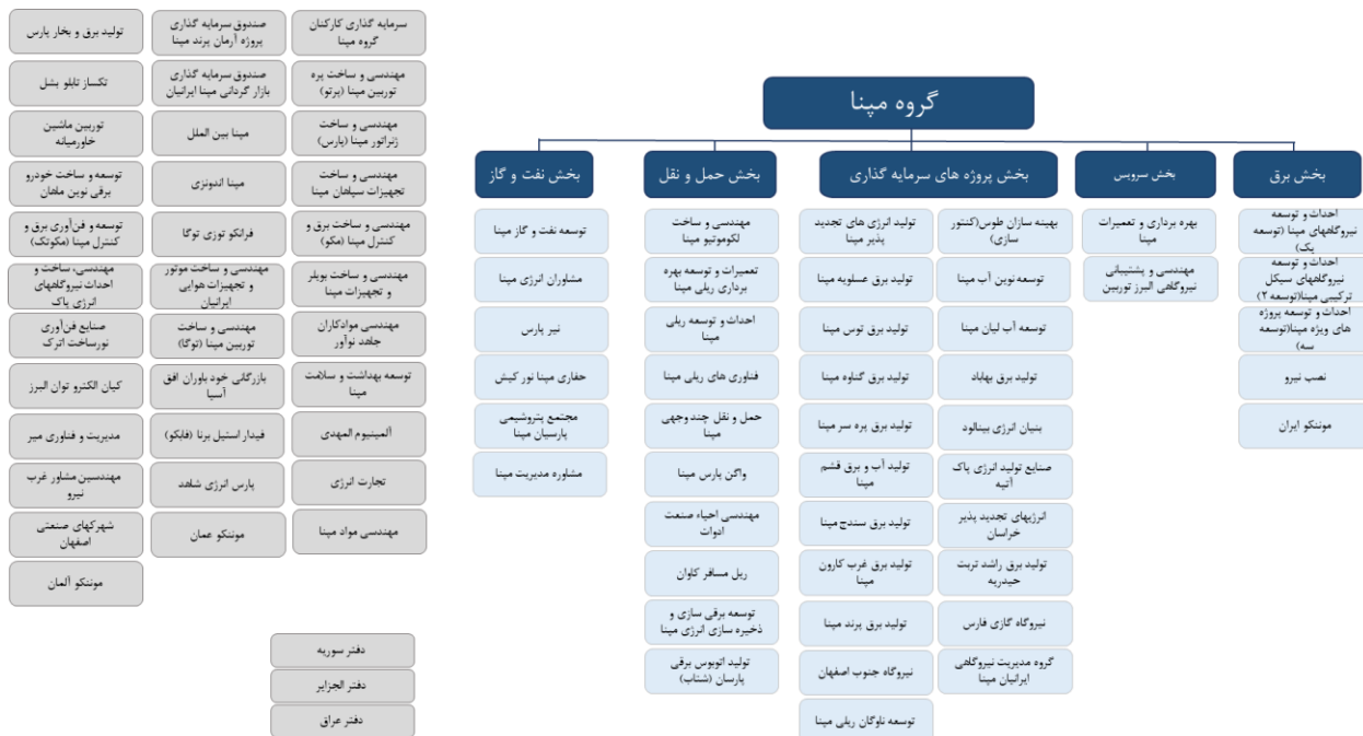
شکل ۱: ساختار بخش های مختلف شرکت گروه مپنا

شرکت گروه مپنا در سه حوزه اصلی نیرو، نفت و گاز و حمل و نقل به طور گسترده و به صورت EP, EPC, EPCF, BOO, BOT و غیره مشغول به فعالیت است. شرکت گروه مپنا با قابلیت های فناورانه طراحی و ساخت انواع توربین، پره های توربین و سایر تجهیزات اصلی نیروگاهی، نیروگاه های سیکل ترکیبی و تجدیدپذیر حوزه برق، طراحی و ساخت انواع لکوموتیو، واگن، خودرو و اتوبوس برقی و ایستگاه های شارژ در حوزه حمل و نقل و طراحی و ساخت انواع توربو کمپرسورها و الکترو کمپرسورها حوزه نفت و گاز به عنوان یک شرکت دانش بنیان، فعال می باشد. علاوه بر حوزه های اصلی فوق، گروه مپنا در حال توسعه برخی دیگر از حوزه های کسب و کاری نظیر حوزه صنایع فلزی، معدنی، تعمیرات موتور هواپیمای مسافری، سلامت نیز می باشد. این شرکت در قالب پنج بخش، ساختار بندی شده است که مطابق شکل زیر شامل بخش های "برق، سرویس، حمل و نقل، نفت و گاز و پروژه های سرمایه گذاری" می باشد که در مجموع شامل ۸۱ شرکت زیر مجموعه می باشد.